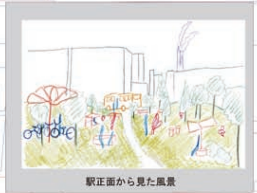
駅正面から見た風景