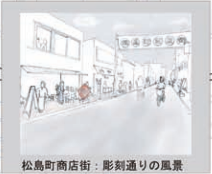
松島町商店街：彫刻通りの風景