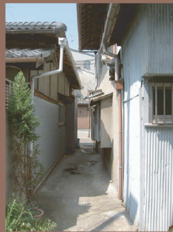
▲今も多くみられる路地