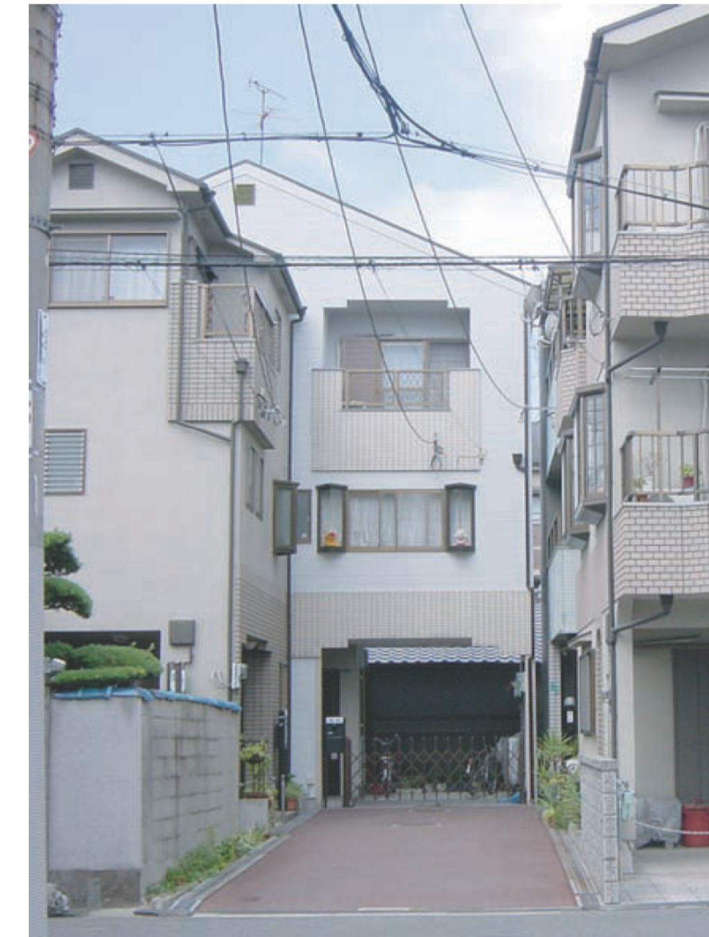
▲行き止まりの引き込み道路