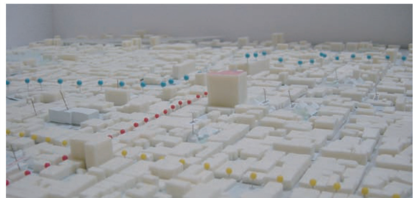
▲完成後のマンションを含む景観を予想した模型 低層の建物が多いため、高層建築が非常に目立ってしまう。