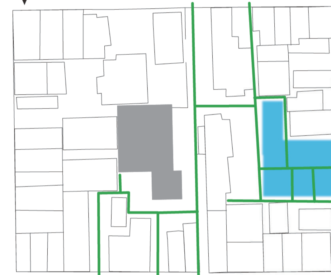
(2) にんにやかハウスによって駐車場の活用と路地が繋がる