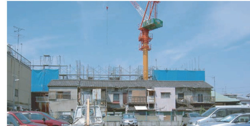
▲建設中のマンション