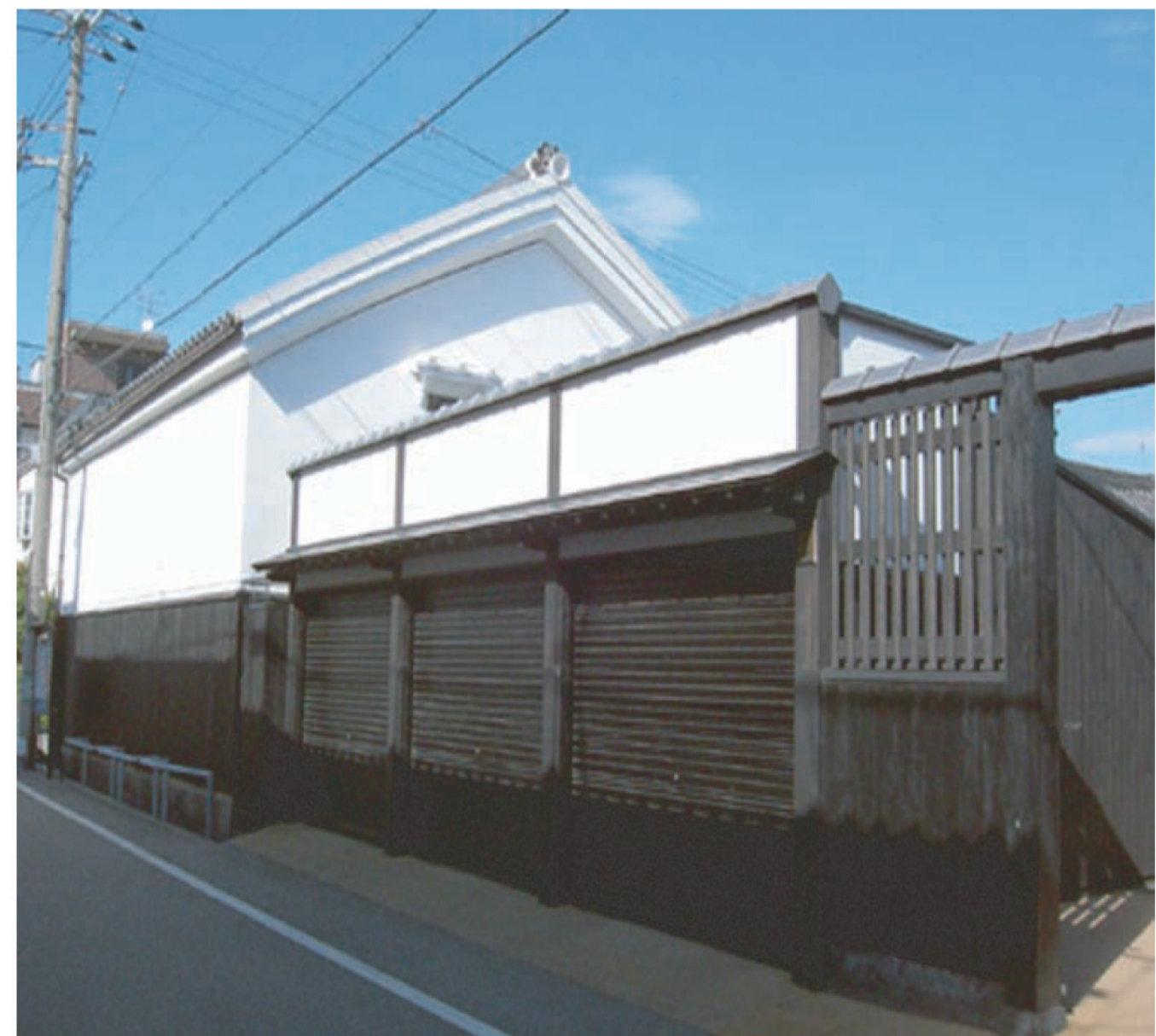
▲修景されたパーキング HOPE事業によってまちを修景していこうという動きがみられる。