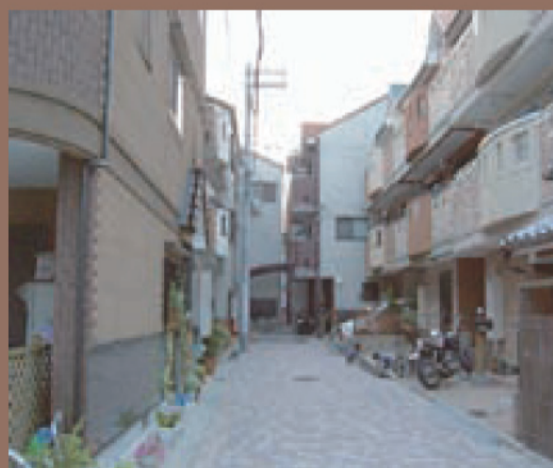
▲多くみられるミニ開発

法律の改正によって高層マンションの建設が可能になった 現在平野の中心に12階建てのマンションが建設中 2、3階建ての建物が多い平野の景観にそぐわないのは明確である 地元住民の反対にあっているが合法のため建設中止は難しい