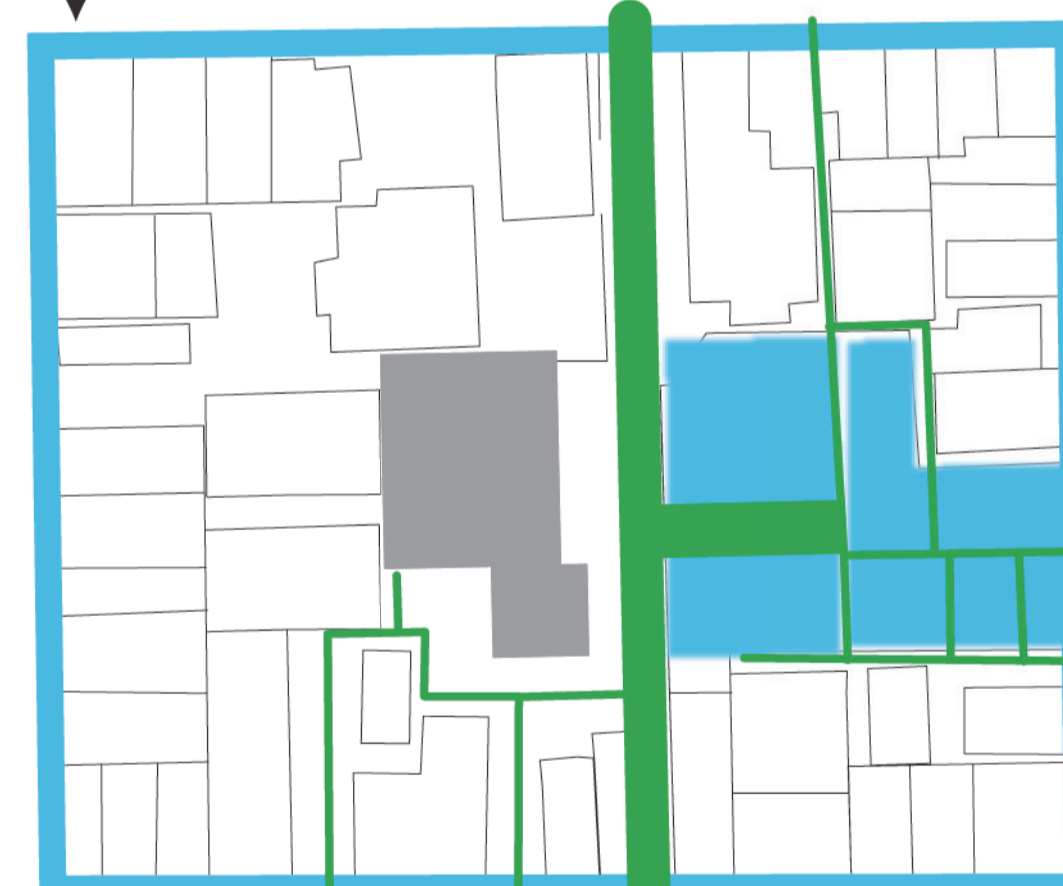
(3) 同じ街区でにんにやかハウス広がる。路地も繋がる。

このにんにやかハウスが平野に広がり、にんにやか街区ができあがっていくことで、平野が路地で繋がり緑で繋がり、人でつながり、「にんにやか」になるのです！（4）