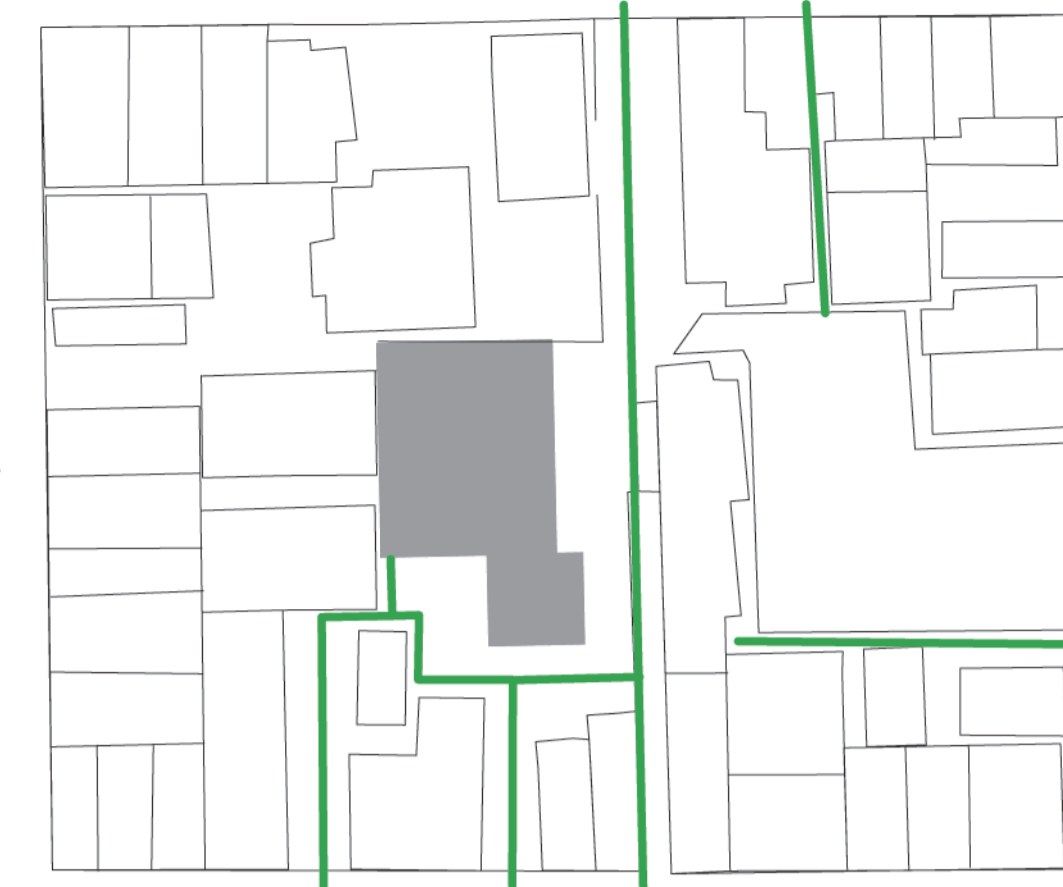
(1) 大きな駐車場と行き止まりの路地がみられる